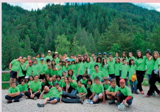
Turno Elementari 2011