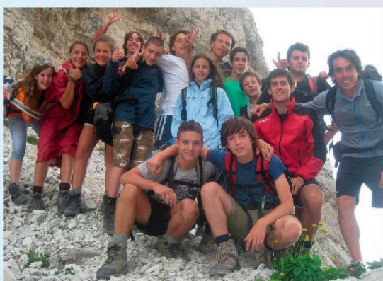
La meta raggiunta