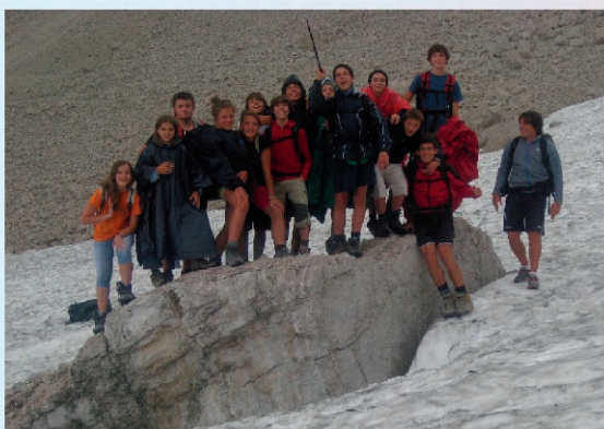
In mezzo alla neve