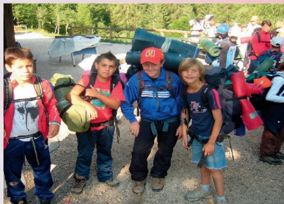
Si parte per l'escursione