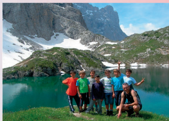
Sul lago del Coldai