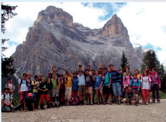
Sotto il Pelmo