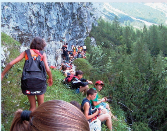
Sul Viaz de l'Ariosto