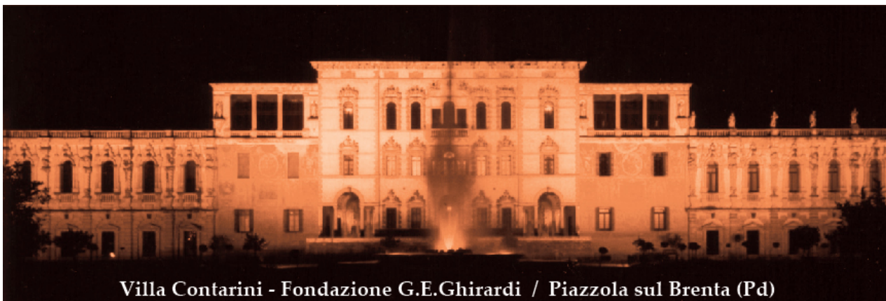
Villa Contarini - Fondazione G.E.Ghirardi / Piazzola sul Brenta (Pd)